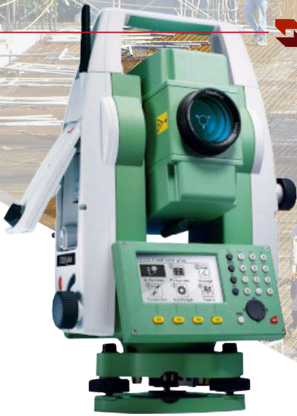
TOTAL STATION LEICA TS06 FLEXLINE